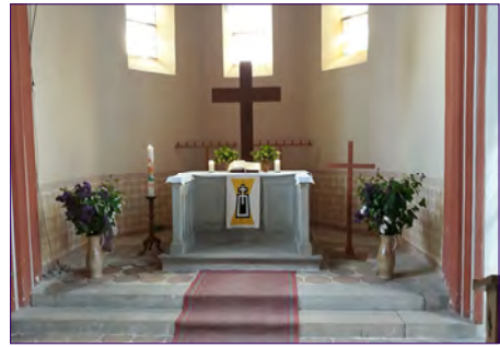
Weidener Altar zu Himmelfahrt.

Am 14. Mai 2026 feierten Christinnen und Christen aus unseren Dörfern wieder einen regionalen Gottesdienst zu Christi Himmelfahrt in Weiden. Thematisch wurde der Song von Herbert Grönemeyer "Ein Stück vom Himmel" eingebunden in Grönemeyers Schaffen - und dieses wurde wiederum an das Evangelium von der Himmelfahrt Christi, also Jesu heutiges Wirken in unserer Welt durch Heilige Geistkraft, angebunden. Wer gibt uns heute Geistkraft und Trotz-kraft? Gott klingt oft genug leise in der Welt. Zwischen den Zeilen. Nicht in jedem Glaubensmoment haben wir Flugzeuge im Bauch. Und Gott - war in Jesus von Nazareth. Mensch wie wir. Aufstehen im Firmament. Ein Stück vom