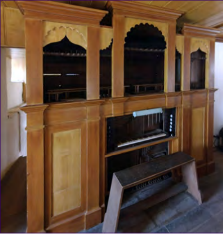
Generalreinigung der Orgel.