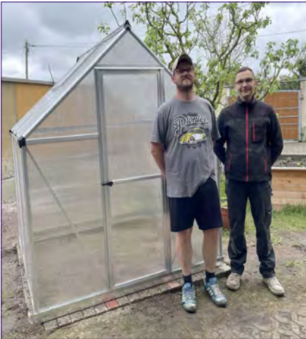
Das neue Gewächshaus in der Kita.

Für die Kinder des Ev. Kindergartens in Rodleben gab es ein neues Gewächshaus. Neben den Hochbeeten bietet es den perfekten Ort für das Anpflanzen und Ernten von verschiedenem Obst, Gemüse und Kräutern. Die ersten Ideen wurden von den Kindern bereits gesammelt. So sollen bald Tomaten, Paprika, Erdbeeren und andere leckere Lebensmittel geerntet werden. Wir