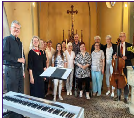
Nach dem Konzert in Rietzmeck.