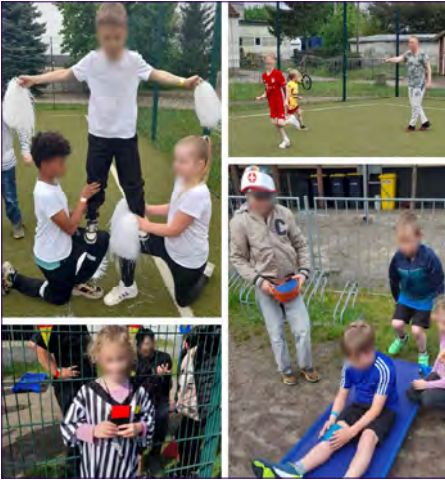
Fußball im Hort Rodleben.