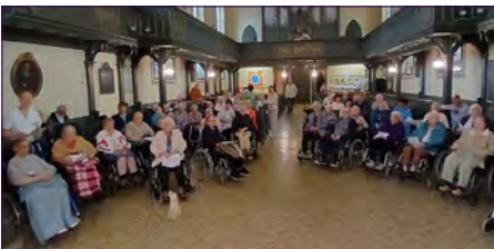
Nach dem Gottesdienst in Roßlau.

In diesem Jahr hat es wieder vor der Sommerpause geklappt, dass die Bewohner aus dem Haus an der Rossel am Freitag, dem 5. Juni einen Gottesdienst in der Marienkirche feiern konnten. Das Wetter hat für die Ausfahrt gut mitgespielt und ein ganzer Stab von Pfle-