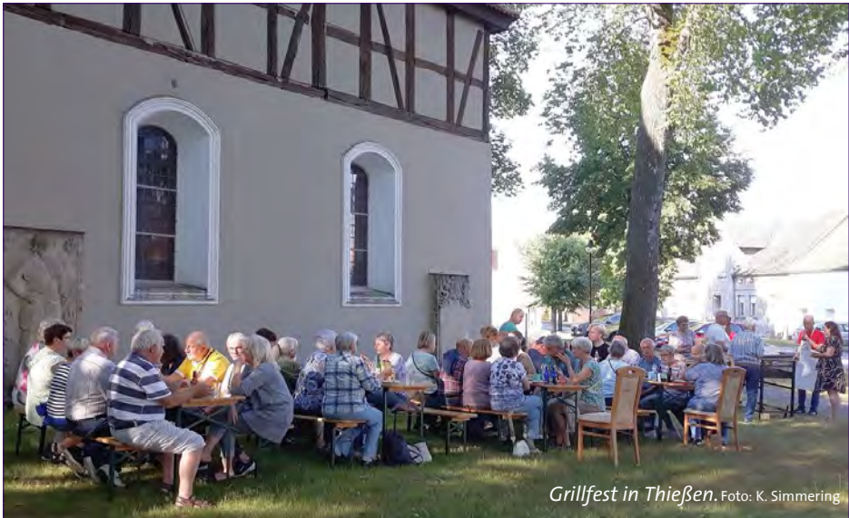
Grillfest in Thießen.