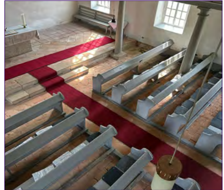
Neue Läufer in der Kirche Serno.

Schon lange hatten wir für zwei neue Läufer in der Kirche Serno gesammelt - nun wurden sie in diesem Frühjahr angeschafft und ausgelegt. Durch die frische Farbe der Läufer erstrahlt der Kirchraum in neuem Glanz. K. Simmering